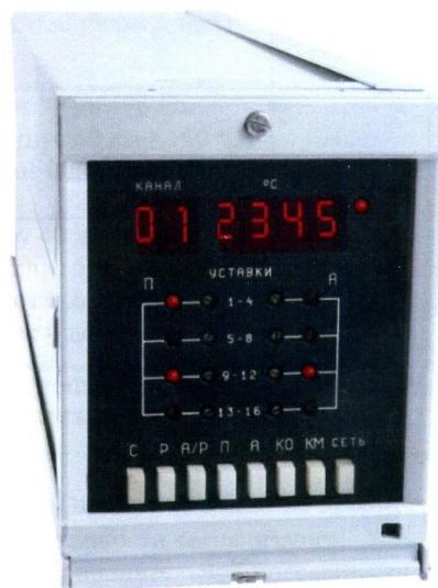
Рисунок 1 – Фотография общего вида

Фотография общего вида приведена на рисунке 1. Схема пломбировки от несанкционированного доступа приведена на рисунке 2.